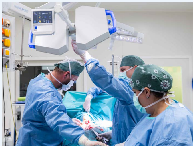
Operační sály dříve a dnes